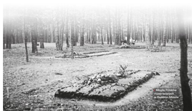
Mogiła Polaków rozstrzelanych w Rudzkim Moście

W 1946 roku podczas ekshumacji wydobyto zwłoki 236 osób. Z nazwiska znamy tylko co drugą ofiarę. W egzekucjach mordowano przede wszystkim miejscową inteligencję, dziennikarzy, drukarzy, nauczycieli, studentów, działaczy społecznych, kupców i rzemieślników. Rozstrzelano także więźniów przewiezionych z obozu przejściowego w Radzimi (powiat sępoleński).