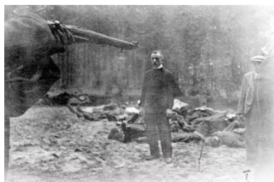
Egzekucja ks. Piotra Sosnowskiego

Jak wykazało późniejsze śledztwo, w rzeczywistości budynek spłonął wskutek zaprószenia ognia przez pijanego właściciela gospodarstwa, który wyrzucił niedopałek cygara. Nawet niemiecki wojskowy sąd doraźny (Standgericht der Wehrmacht) uniewinnił Polaków aresztowanych bezpośrednio po tym zdarzeniu. Mimo to członkowie Selbstschutzu rozpoczęli aresztowania i egzekucje Polaków, wykorzystując rzekome podpalenie stodoły jako pretekst do przeprowadzenia akcji eksterminacyjnej.