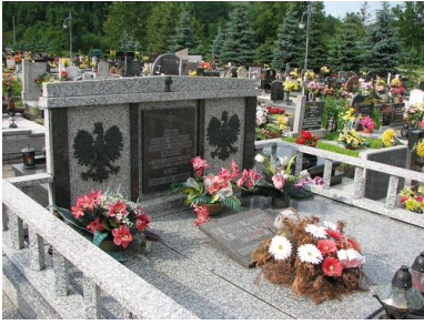
Mogiła Polaków poległych podczas starć polsko-czeskich w 1919 roku na cmentarzu w Zebrzydowicach.