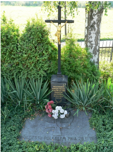
Mogiła poległych w walce i zamordowanych przez Czechów w Stonawie 26 stycznia 1919 r.