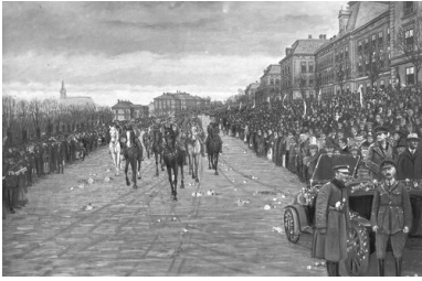
Wkroczenie wojsk polskich do Cieszyna po rozejmie z Czechami w lutym 1919 r.