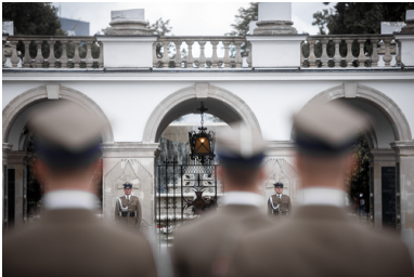
Wojna polsko-czechosłowacka w dniach 23-30 stycznia 1919 roku i bitwa pod Skoczowem zostały upamiętnione na jednej z tablic Grobu Nieznanego Żołnierza w Warszawie.