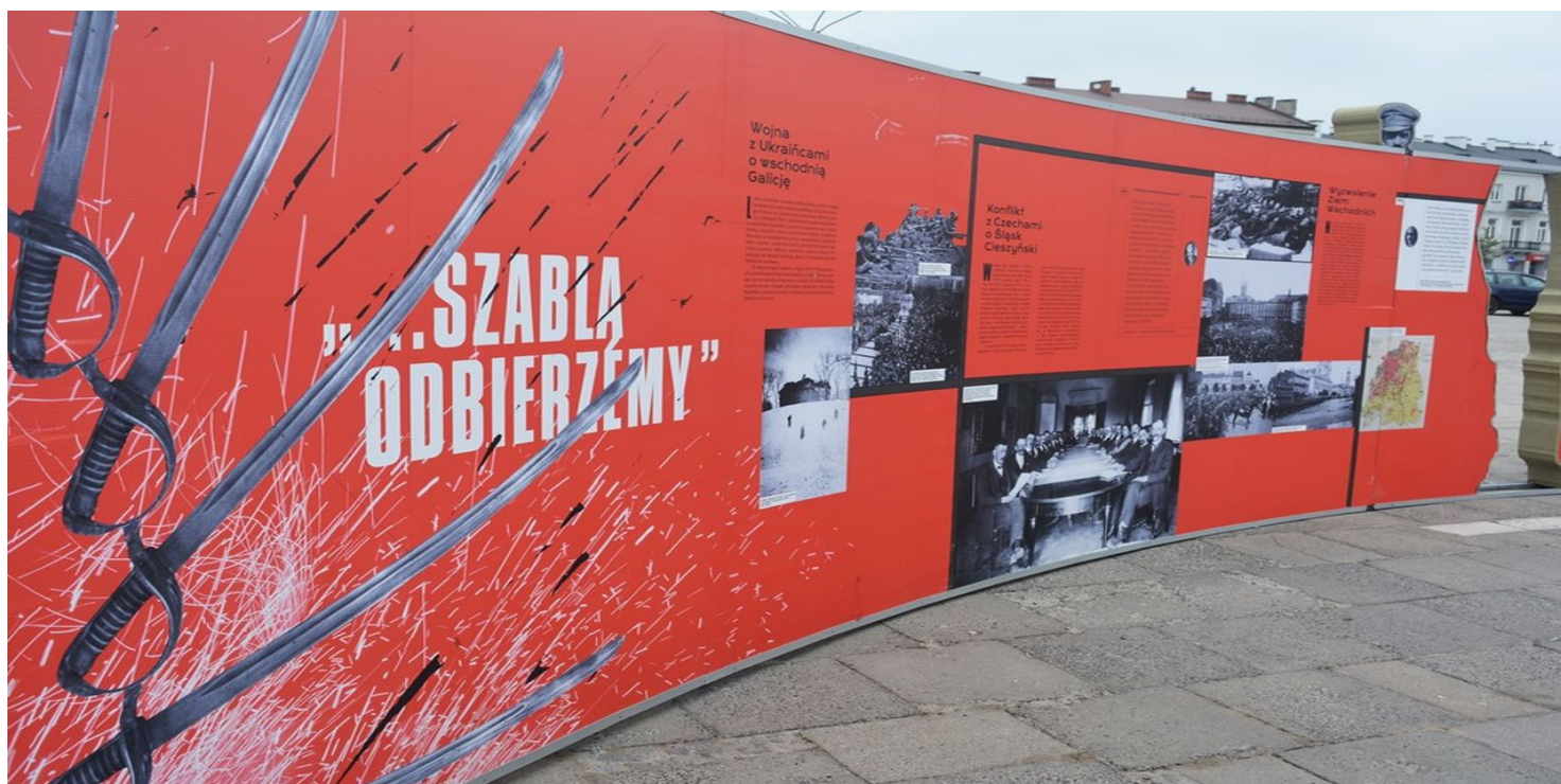
Element wystawy IPN „Powstała, by żyć”, opisujący m.in. konflikt o Śląsk Cieszyński.

https://przystanekhistoria.pl/pa2/tematy/martyrologia/63534,Polsko-czechoslowacki-konflikt-w-1919-r.html