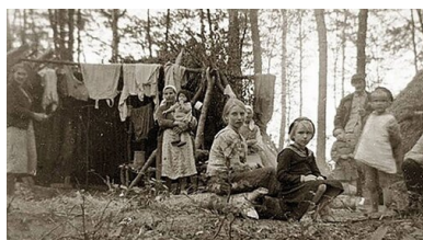
Wieś Przebraże w pow. łuckim - uchodźcy w bazie samoobrony.