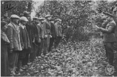
Szubin, 21 października 1939 r. Tuż przed egzekucją. Dwóch oficerów SS (jeden z nich to SS- Sturmbannführer Ernest Tiedemann) odczytuje wyrok śmierci grupie Polaków.

Żadne listy proskrypcyjne nie były okupantowi potrzebne w przypadku Żydów, z którymi od początku postępowano brutalnie i okrutnie. Podstawą prześladowań było pochodzenie; nie czyniono różnicy ze względu na zaangażowanie polityczne lub działalność „antyniemiecką”. Represje wobec ludności żydowskiej miały bardzo szeroki zakres. Od gmin wymuszano płacenie wysokich kontrybucji, rabowano i konfiskowano mienie ich członków (przede wszystkim sklepy). Zmuszano też Żydów do pracy na rzecz okupanta, poniżano ich i bito. Rujnowano miejsca kultu religijnego: jesienią 1939 r. zostało spalonych lub zdemolowanych wiele synagog. Niszczono zwoje Tory i biblioteki żydowskie. Na ziemiach zachodnich II Rzeczypospolitej jeszcze w trakcie działań wojennych rozpoczęły się „dzikie” wypędzenia Żydów, których Niemcy wyganiali z domów i kierowali na wschód: na ziemie Generalnego Gubernatorstwa lub do strefy okupowanej przez Związek Sowiecki. Rozpoczęły się egzekucje, chociaż w tym okresie Niemcy poszukiwali jeszcze pretekstu. Mogły nim być posiadanie broni (niekoniecznie palnej), nieprzestrzeganie zarządzeń okupanta lub podejrzenie