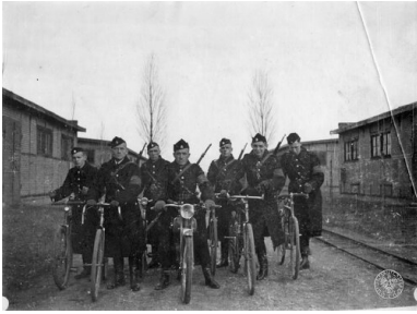
Jesień 1939 r. Członkowie grudziądzkiego Selbstschutzu w czasie "patrolu".