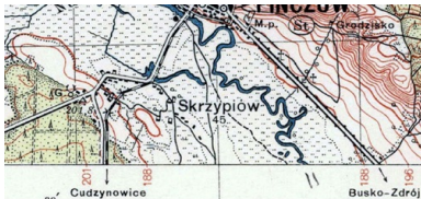
Skrzypiów na mapie wojskowej z 1939 r.