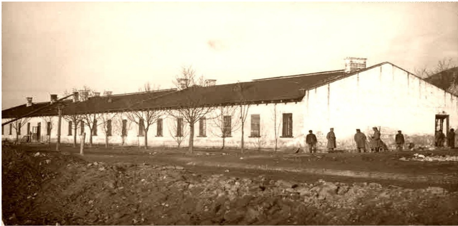
Antoni Kuczek polska-org.pl Więzienie w Pińczowie. Fot. ze zbiorów Muzeum Regionalnego w Pińczowie

https://przystanekhistoria.pl/pa2/tematy/martyrologia/77927,Egzekucje-mieszkanek-Radomia-w-Lesie-we-Wloszczowicach-oraz-w-Lesie-Skrzypiowski.html