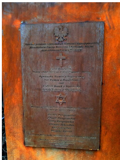
Tablica pamiątkowa na pomniku w Popardowej.