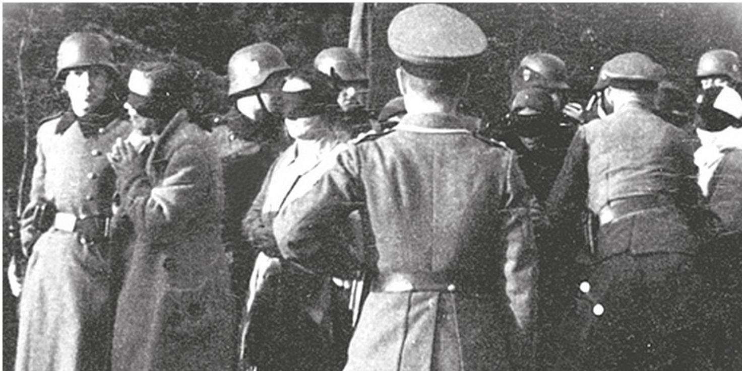
Egzekucja w Palmirach

https://przystanekhistoria.pl/pa2/tematy/martyrologia/82835,Palmiry-symbol-niemieckiego-okrucienstwa.html