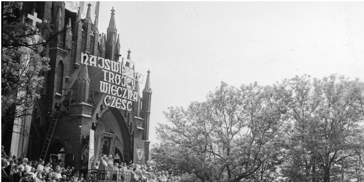
Fot. z zasobu IPN

https://przystanekhistoria.pl/pa2/tematy/milenium/68370,Milenium-Chrztu-Polski-w-Piekarach-Slaskich-Duchowej-Stolicy-Gornego-Slaska.html