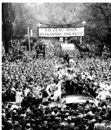
Powitanie Prymasa Stefana Wyszyńskiego (widoczny z lewej strony samochodu u dołu fotografii) przed bramą wjazdową

22 maja 1966 r. po południu na Kalwarii Piekarskiej rozpoczęły się tradycyjne nauki stanowe prowadzone przez biskupów i księży. Szczególnie oryginalne, jak na tamte czasy, były te prowadzone przez księdza Stanisława Sierłę, prekursora piosenki religijnej w Polsce, który z gitarą z balkonu kaplicy wykonywał pieśni kościelne.