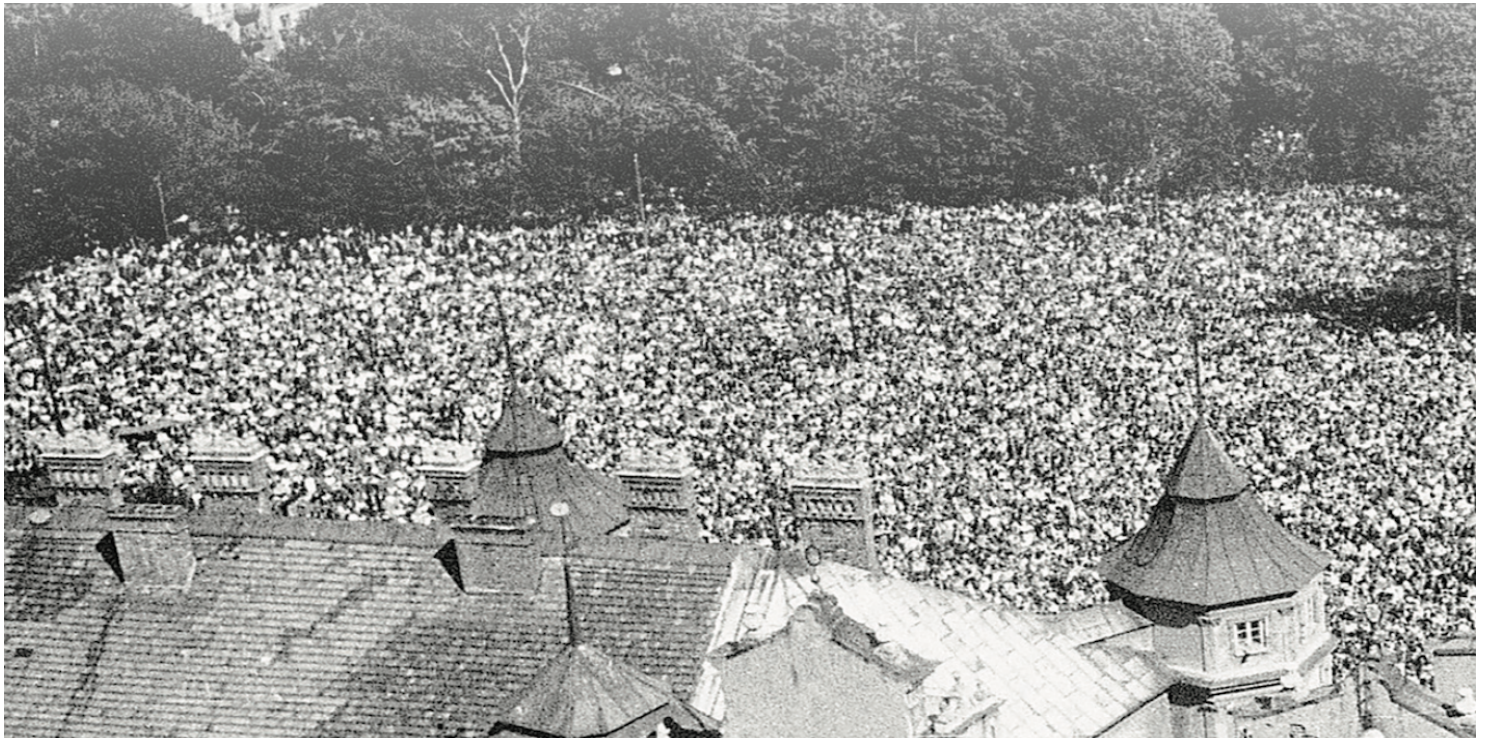
Blisko milionowa rzesza wiernych pod szczytem Jasnej Góry, 26 sierpnia 1956 r.

https://przystanekhistoria.pl/pa2/tematy/milenium/85556,Jasnogorskie-Sluby-Narodu-Polskiego.html