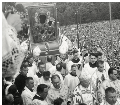
Cudowny Obraz Matki Boskiej Częstochowskiej wyniesiony na Wały Jasnogórskie, 26 sierpnia 1956 r.