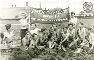
Junacy hufca Powszechnej Organizacji „Służba Polsce” działającego przy Gimnazjum Przemysłowym Cukrowni „Świdnica” w Pszenniu, b.d. Kopia cyfrowa zdjęcia przekazana do zasobu IPN przez p. Piotra Kraśnianina (fot. z zasobu IPN)