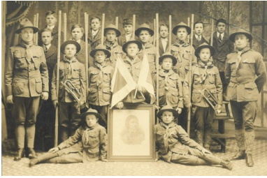
Drużyna harcerska Związku Sokołów Polskich w Ameryce z portretem Tadeusza Kościuszki, 1917 r.