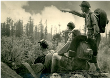
Polscy harcerze w Stanach Zjednoczonych podczas jednego z obozów, 1936 r.