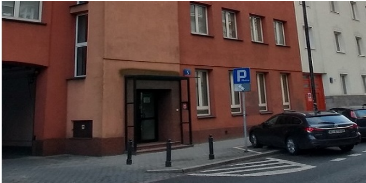
Budynek przy ulicy Nowogrodzkiej 5 w Warszawie, w którym (na I piętrze) mieścił się klub studencki „Babel” – widok współczesny

https://przystanekhistoria.pl/pa2/tematy/mlodziez/106572,Babel-Klub-studencki-zagraza-bezpieczenstwu-i-porzadkowi-publicznemu.html