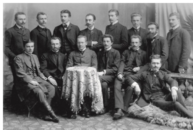
Kazimierz Bartel (stoi drugi z lewej) z kolegami ze studiów.

To rozpolitykowanie młodzieży nierzadko wpływało negatywnie na przebieg studiów – wymagania stawiane przez profesorów były bowiem bardzo wysokie; w szczególności problem stwarzało terminowe zdawanie egzaminów. Jeśli natomiast chodzi o orientacje ideowe, politechnika była domeną wpływów młodzieży „postępowej”, w przeciwieństwie do uniwersytetu, gdzie przewagę miała młodzież narodowa.