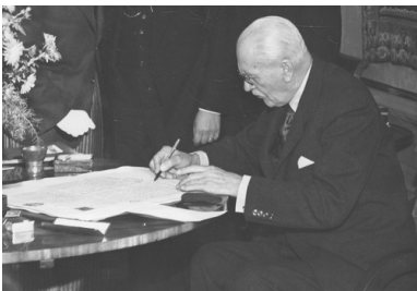
Podpisanie przez prezydenta RP Ignacego Mościckiego aktu erekcyjnego pod budowę nowych gmachów Wydziału Mechanicznego i Elektrotechnicznego Politechniki Lwowskiej, 1938 r. Przed objęciem urzędu Głowy Państwa