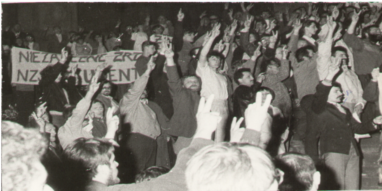
Manifestacja na schodach katedry Chrystusa Króla.

https://przystanekhistoria.pl/pa2/tematy/mlodziez/72300,Czy-studenci-pobili-sie-sami.html