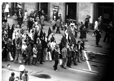
„Czarny marsz”, Kraków, 17 maja 1977 r.