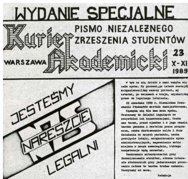
Pierwsza strona „Kuriera Akademickiego” informującego o rejestracji NZS, październik - listopad 1989 r.

Mimo sprzeciwu ze strony radykalnych działaczy, którzy wykluczali negocjacje z komunistami jako niemoralny kompromis, władze NZS zdecydowały się na przystąpienie do rozmów okrągłego stołu. „Solidarność” wyszła z negocjacji zwycięsko, wywalczyła prawo do funkcjonowania związku oraz częściowo wolne wybory. Nie da się tego powiedzieć o NZS, którego główny postulat – ponownej legalizacji – pozostał niespełniony. Tylko Jerzy Urban cynicznie zauważył, że komuniści powinni przystać na żądania NZS: