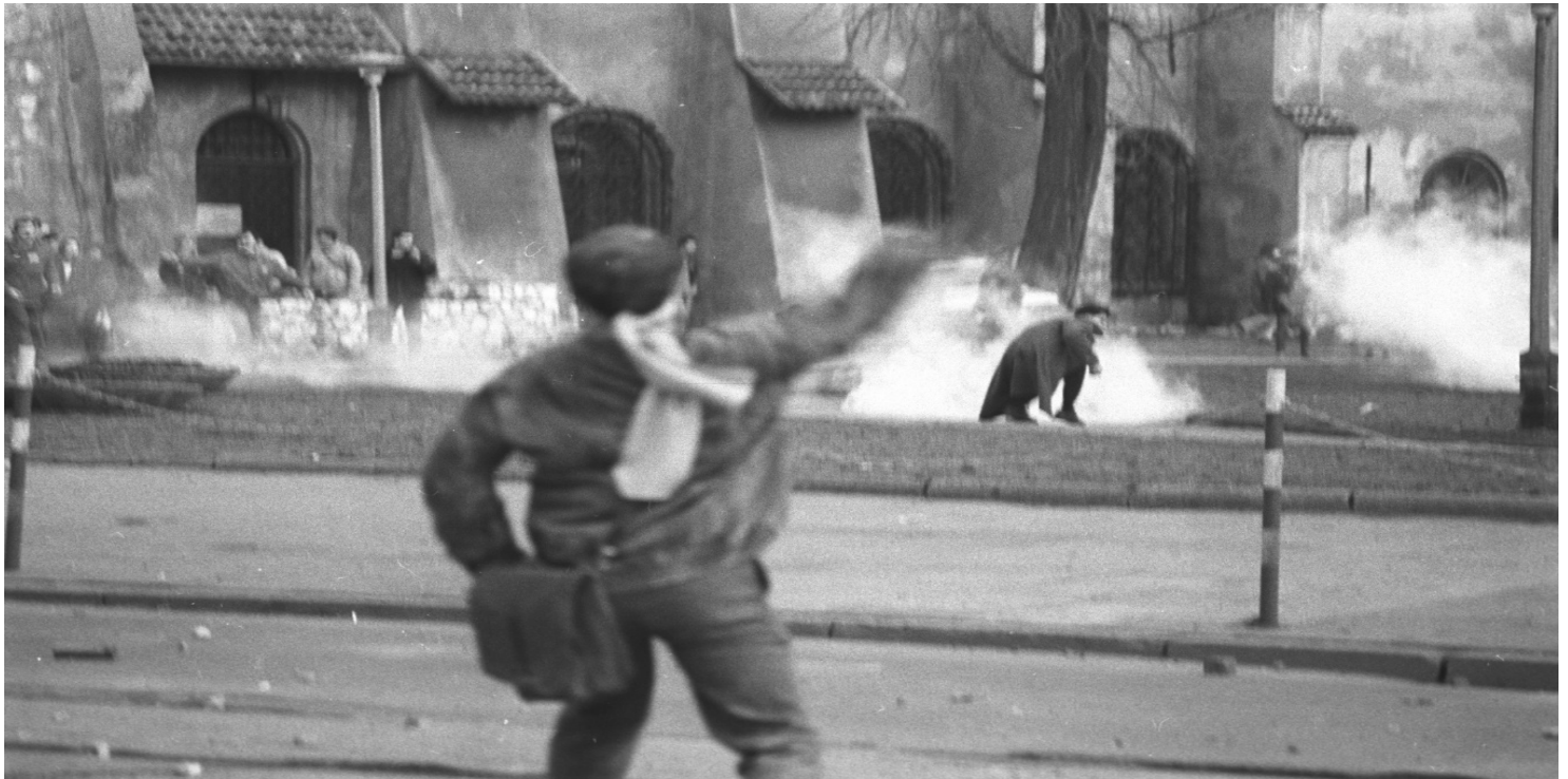
Zamieszki w Krakowie 24 lutego 1989 r. (FCDCN, fot. A. Stawiarski)

https://przystanekhistoria.pl/pa2/tematy/mlodziez/74426,Mloda-Solidarnosc.html