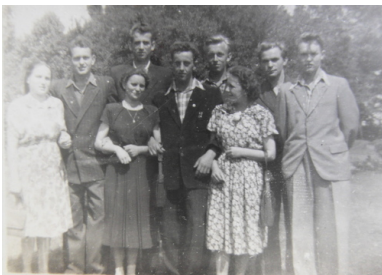
Członkowie organizacji w 1952 r. nieopodal tomaszowskich Niebieskich Źródeł