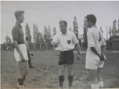
Przed meczem piłkarskim „Ogniwa” w 1952 r.