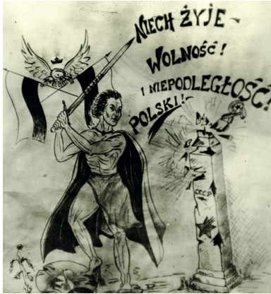
Rysunek propagandowy wykonany przez członków Związku Młodej Polski z Bytomia

Gros z nich (ok. 66 proc.) powstało po 1948 r., w okresie realizacji projektu totalitarnego. Łącznie w latach 1944–1956 w Polsce istniały przynajmniej 972 podziemne grupy młodzieżowe, skupiające ok. 11 tys. członków.