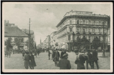
Łódź, Plac Wolności. Pocztówka wydana w Warszawie w okresie wolnej Polski - Drugiej Rzeczpospolitej.