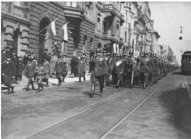
Święto Narodowe Trzeciego Maja - uroczystości w Łodzi. Defilada wojska na ulicach miasta. Widoczne kamienice udekorowane flagami państwowymi. Fotografia z okresu innej, jeszcze wolnej, Polski - Drugiej Rzeczpospolitej.

Po zakończeniu wojny Polacy zaczęli spontanicznie obchodzić rocznicę uchwalenia Konstytucji 3 maja.