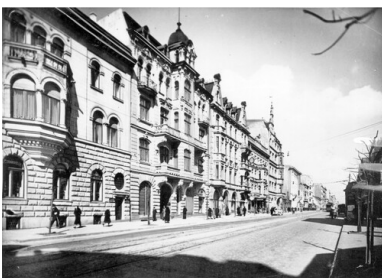
Łódź, ul. Piotrkowska, 1943.

Z brutalnością władz nie dało się wygrać. Łódzka młodzież pokazała jednak ponownie, że narzucony system może być utrzymany tylko siłą.