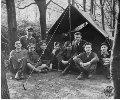
Grupa harcerzy ZHP przed namiotem, 1947.