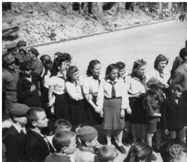
Uroczystości z udziałem młodzieży reprezentującej różne organizacje (ZHP, ZMP?, wojsko?), 1947.

W pierwszej połowie 1950 r. eliminowano emblematy organizacyjne i tradycyjne formy pracy. Z mundurów harcerskich zniknęły krzyże i lilijki, a w ich miejsce pojawiły się odznaki wzorowane na znaczku ZMP.