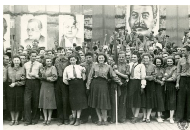
Członkowie Związku Młodzieży Polskiej (ZMP) prawdopodobnie przed pochodem 1 Maja w Gdańsku, 1945 - 1952.

Nowemu programowi nadano nazwę Harcerska Służba Polsce. Miał to być element kampanii ideologicznej, której celem było wyrugowanie dotychczasowego dorobku wychowawczego ZHP. Związek zaangażowano w odbudowę kraju, co częściowo pokrywało się z zadaniami spontanicznie podejmowanymi przez środowiska harcerskie jeszcze w 1944 r. Akcja letnia w 1948 r. realizowała uzgodnione z władzą zadania, do których należały takie projekty jak „Las i rola”, „Odbudowa”, „Kultura i oświata” oraz „Dziecko i zdrowie”. W akcji wzięło udział około 30 proc. członków ZHP, nie przyniosła jednak oczekiwanego przez komunistów skutku, gdyż podejmowane zadania nie miały charakteru politycznego, a młodzież nie zdawała sobie sprawy z sensu przemian, w których brała udział.