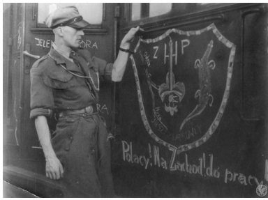
Harcerz z drużyny „Jaszczurkowcy” ZHP zachęca do wyjazdu na zachód kraju, 1945 - 1950.