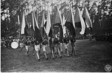
Związek Harcerstwa Polskiego (ZHP) w Opolu, 1947. Uroczystości na niewielkim stadionie.

Organizacja, ciesząca się taką popularnością wśród młodzieży, stała się obiektem zainteresowania partii politycznych. Walka o wpływy w harcerstwie początkowo odbywała się tylko na szczeblu władz związkowych oraz na forum Komisji Porozumiewawczej Organizacji Młodzieżowych. Praca wychowawcza na niższych szczeblach toczyła się według tradycyjnych, przedwojennych wzorców.