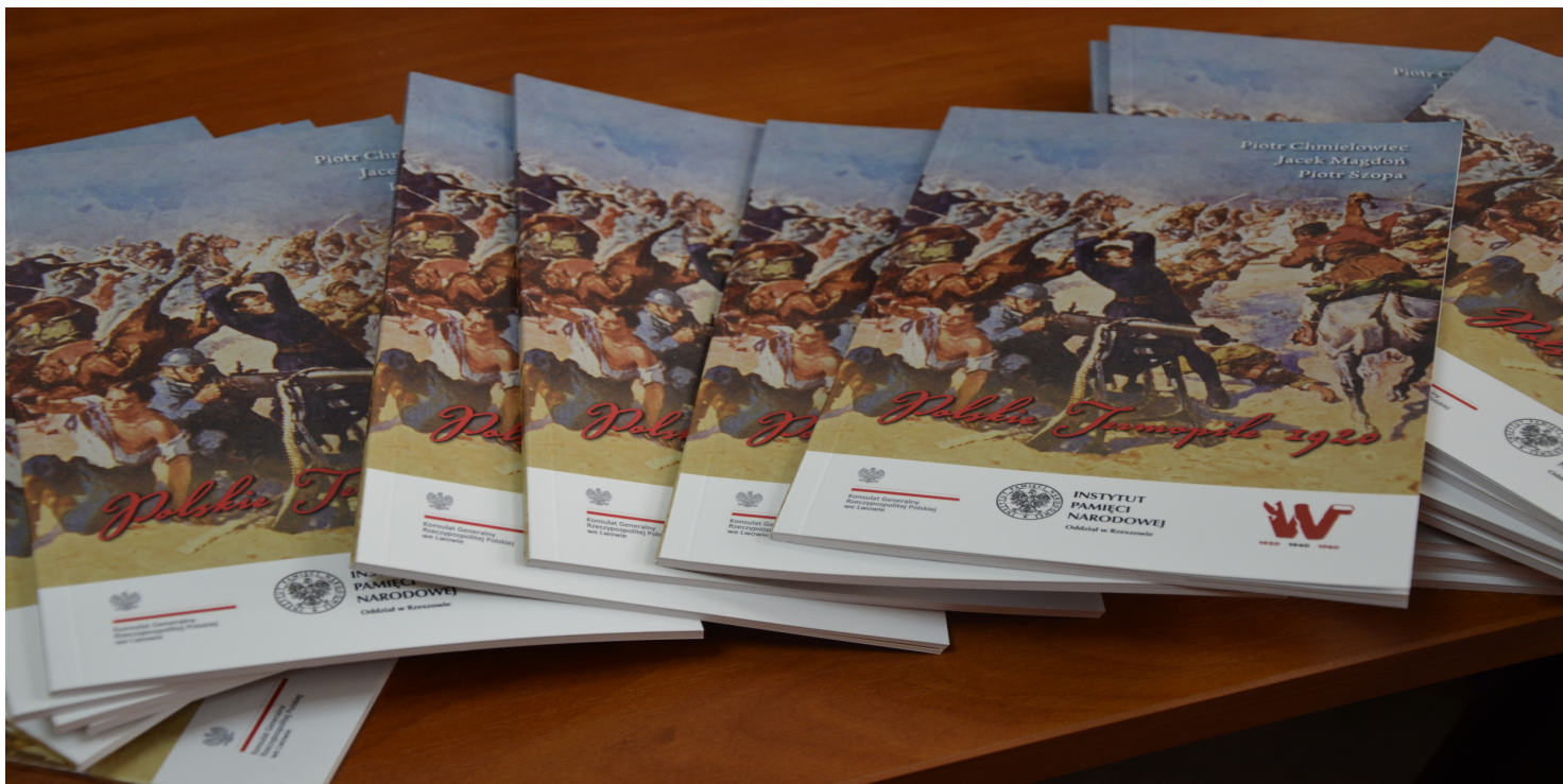
„Polskie Termopile 1920” – publikacja IPN Rzeszów na 100- lecie zwycięstwa nad bolszewikami

https://przystanekhistoria.pl/pa2/tematy/mlodziez/87668,Firlejowka-wrzesniowy-boj-1920-roku.html