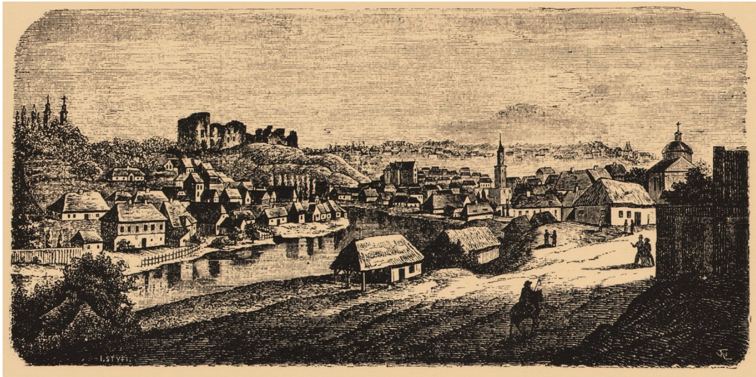
Buczacz na litografii z XIX wieku

https://przystanekhistoria.pl/pa2/tematy/mniejszosci-narodowe/22561,Buczacz-polsko-zydowskie-dziedzictwo-1.html