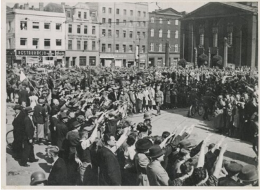
Wkroczenie wojsk niemieckich do Katowic, 4 września 1939 r., rynek.

Z punktu widzenia władz niemieckich najmniej problematyczne były tereny należące przed wybuchem II wojny światowej do Niemiec: ich mieszkańcy posiadali obywatelstwo niemieckie i byli uznawani za Niemców. Wątpliwości nie budził też status narodowościowy i rasowy ludności (liczącej ok. 1 mln osób) „pasa wschodniego”, zamieszkiwanego głównie przez Polaków i ponad 100 tys. Żydów. Podobny charakter miała również część powiatu częstochowskiego, która została wcielona do rejencji opolskiej (jako powiat zawierciańsko-blachowniański). O wiele bardziej złożona była kwestia narodowości mieszkańców przedwojennego województwa śląskiego, dzielącego się historycznie na dwie części: północną, należącą przed 1918 r. do Niemiec (powiaty: tarnogórski, katowicki, pszczyński, rybnicki oraz miasta na prawach powiatu Chorzów i Katowice), i południową, należącą w przeszłości do Austro-Węgier (powiaty cieszyński i bielski).