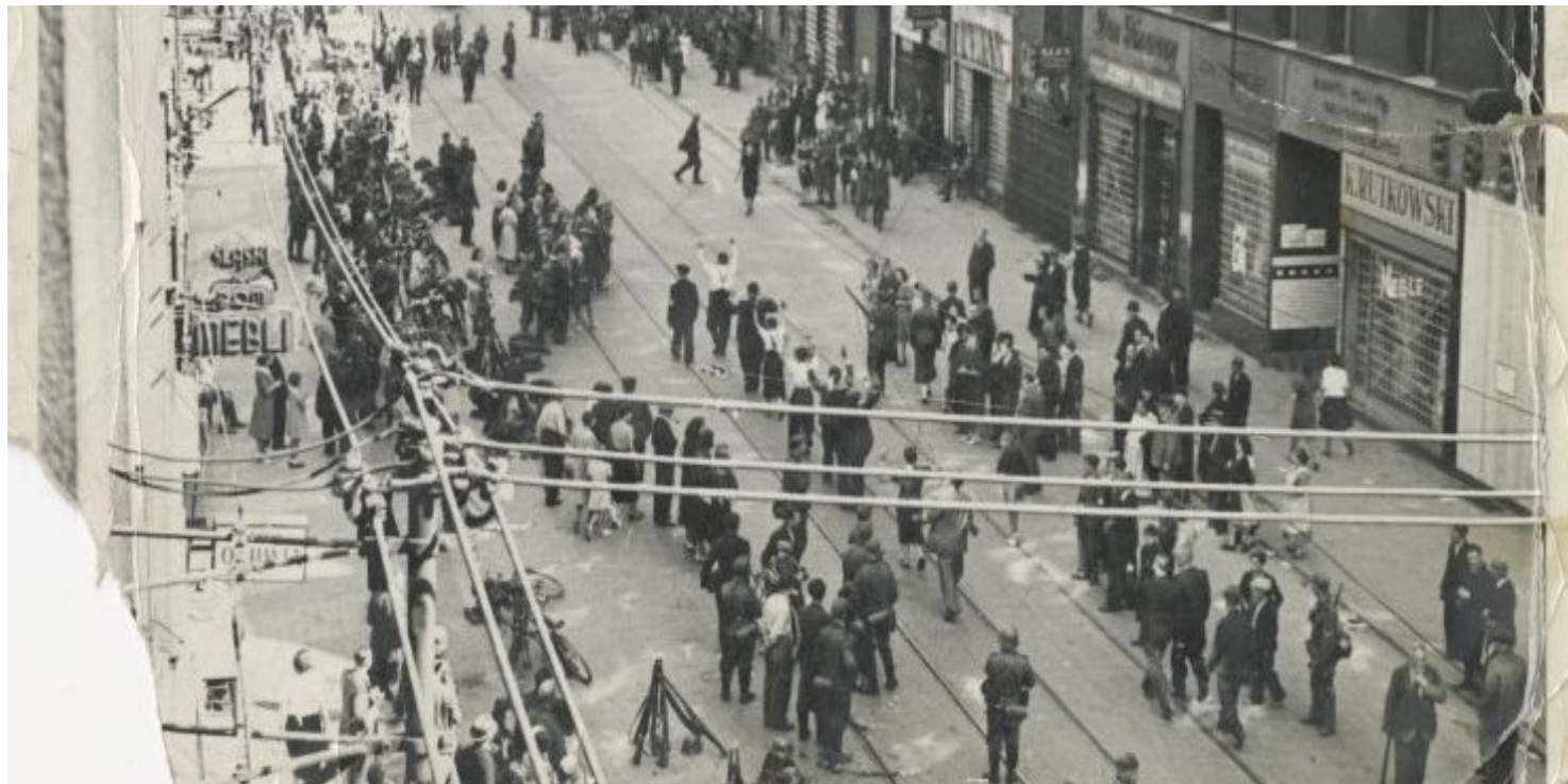
Fot. ze zbiorów Muzeum Historii Katowic

https://przystanekhistoria.pl/pa2/tematy/mniejszosci-narodowe/68652,Kwestia-folkslisty-na-Gornym-Slasku.html