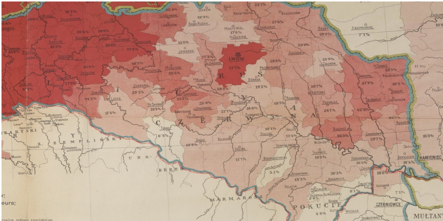
Fragment mapy przedstawiającej rozsielenie ludności polskiej w granicach etnograficznych, 1915 r. (Biblioteka Narodowa)

https://przystanekhistoria.pl/pa2/tematy/mniejszosci-narodowe/75559,Sabotaze-i-pacyfikacja-Malopolski-Wschodniej-w-1930-roku.html