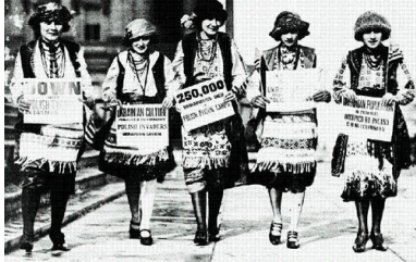
Przykład protestów ukraińskiej diaspory

sprawa była ich „zwycięstwem moralnym”. Mimo ostatecznie pozytywnego rozstrzygnięcia dla Polski nie można zapomnieć o wyrazach poparcia dla sprawy ukraińskiej przez przedstawicieli wielu krajów. Sporym sukcesem było także zjednanie sobie znacznej części opinii publicznej na świecie. Dyskusja na temat akcji pacyfikacyjnej w znacznym stopniu przyczyniła się do zaktualizowania sprawy ukraińskiej na arenie międzynarodowej.