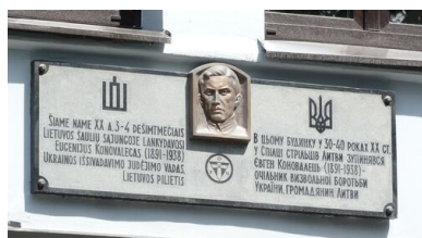
Tablica pamiątkowa Jewhena Konowalca w Kownie, 2017 r.