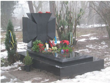
Grób Jewhena Konowalca w Rotterdamie, 2010 r.

W końcu kwietnia 1918 r. doszło do przewrotu i przejęcia władzy przez popieranego przez Niemców gen. Pawła Skoropadskiego, który wkrótce został ogłoszony hetmanem Ukrainy. Na polecenie niemieckich władz okupacyjnych, 1 maja 1918 r. pułk Konowalca został rozformowany, a on sam pozostał w Kijowie. W końcu sierpnia 1918 r. otrzymał od Skoropadskiego rozkaz sformowania samodzielnego pułku Strzelców Siczowych w Białej Cerkwi, a następnie w październiku został jego dowódcą. W czasie antyhetmańskiego przewrotu w listopadzie 1918 r. wraz z podległymi mu pododdziałami przeszedł na stronę Dyktoriatu (URL). Następnie dowodził dywizją, a od 25 listopada 1918 r. korpusem Siczowych Strzelców armii URL w walkach z bolszewikami i białą armią gen. Antona Denikina, która w sierpniu 1919 r. zdobyła Kijów.