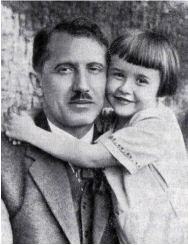
Jewhen Konowalec z synem w Berlinie.