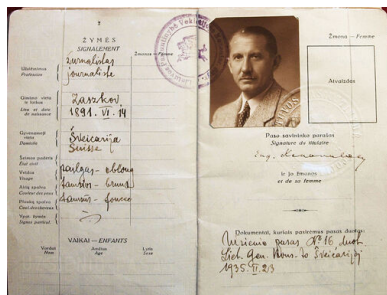
Litewski paszport Jewhena Konowalca, 1938 r.

polskich został zmuszony do wyjazdu ze Szwajcarii. Przeniósł się do Rzymu. Już na terenie Szwajcarii sowieckie służby specjalne podjęły nieskuteczną próbę zamordowania go. Następnie przeprowadzono więc skomplikowane działania operacyjne usiłujące przekonać kierownika OUN do istnienia w USRS antysowieckiego podziemia. Tuż po odbyciu spotkania z rzekomym konspiratorem z sowieckiej Ukrainy (rolę tę odgrywał sowiecki funkcjonariusz NKWD, nielegal Paweł Sudopłatow) Konowalec zginął w wyniku detonacji ładunku wybuchowego ukrytego we wręczonym pakunku 23 maja 1938 r. w Rotterdamie.