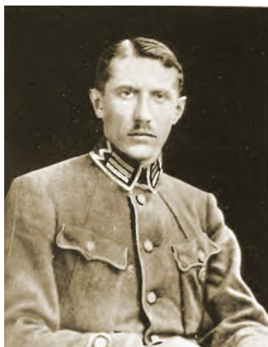
Jewhen Konowalec jako dowódca Korpusu Strzelców Siczowych 1918-1919 r.