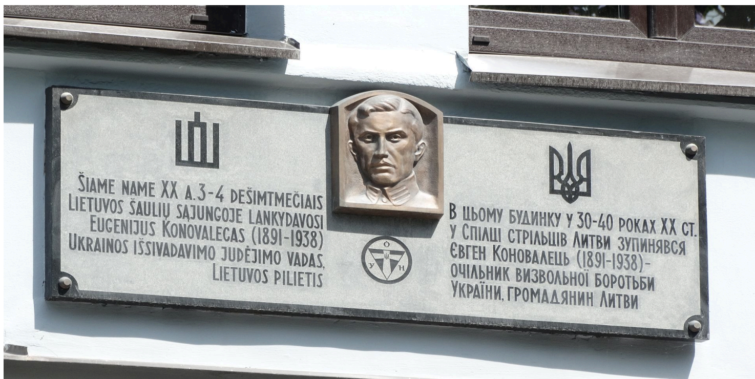
Tablica pamiątkowa Jewhena Konowalca w Kownie, 2017 r.

https://przystanekhistoria.pl/pa2/tematy/mniejszosci-narodowe/80407,Pulkownik-Jewhen-Konowalec.html