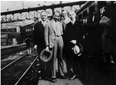
Jewhen Konowalec i Mykoła Sciborski w Paryżu, 1929 r.

W trakcie kierowania organizacją Konowalec odbył sporo podróży zagranicznych, poszukując sojuszników i nakłaniając diasporę ukraińską do przekazywania funduszy na działalność OUN, a także przyczyniając się do stworzenia organizacji afiliacyjnych (jak np. Organizacja Odrodzenia Państwowego Ukrainy - ODWU i Ukraińska Federacja Narodowa - UNO w Ameryce Północnej). Przy pomocy ukraińskich organizacji legalnych składał liczne petycje przeciwko II RP na forum Ligi Narodów, w tym w sprawie pacyfikacji Małopolski Wschodniej z 1930 r.