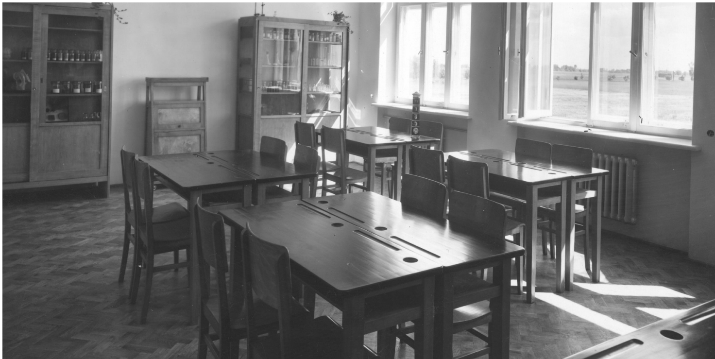
Jedna z sal wykładowych Państwowego Liceum Gospodarstwa Wiejskiego im. Marszałka Józefa Piłsudskiego w Gołotczyźnie, 1939 r.

https://przystanekhistoria.pl/pa2/tematy/narodowe-sily-zbrojne/104889,W-sluzbie-Polsce-Lucyna-Janikowa.htm