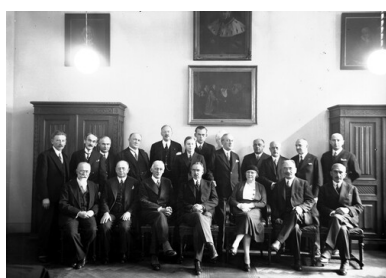
Otwarcie lektoratu języka szwedzkiego na Uniwersytecie Jagiellońskim w Krakowie. Fotografia grupowa uczestników uroczystości. Widoczni m.in.