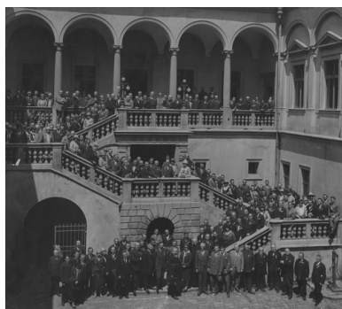
Walny Zjazd Towarzystwa Szkoły Ludowej w Krakowie, 26 lipca 1927 r.

kolejowych, dróg, a także Gdyni i Centralnego Okręgu Przemysłowego. Wprowadzono liczne reformy społeczne, m.in. ośmiogodzinny dzień pracy i korzystne dla pracowników ustawodawstwo socjalne – ubezpieczenia od chorób, wypadków i starości. W porównaniu z okresem niewoli znacząco poprawił się poziom opieki lekarskiej i higieny. Konsekwentnie realizowano obowiązek bezpłatnego i powszechnego nauczania, który w latach trzydziestych objął ponad 90 proc. dzieci; pisanie i czytanie uczone również poborowych w wojsku. Nie do końca jednak wyeliminowano analfabetyzm i analfabetyzm wtórny, który przed wybuchem wojny sięgał 15 proc. W 1932 r. dokonano reformy szkolnictwa, której autorem był minister wyznań religijnych i oświecenia publicznego Janusz Jędrzejewicz. Wprowadzono nową organizację szkolnictwa podstawowego i średniego oraz stworzono szkolnictwo zawodowe. Za główny cel wychowawczy reformy rządzący w tym czasie piłsudczycy uznali kształtowanie wśród młodzieży poczucia obowiązków obywatelskich i pracy dla państwa. Szkolnictwo osiągnęło wysoki poziom dzięki kadrze wykwalifikowanych, ideowych i świadomych wartości swojej pracy nauczycieli. Wychowali oni pokolenie, które w czasie II wojny światowej dało świadectwo patriotyzmu i bohaterstwa.