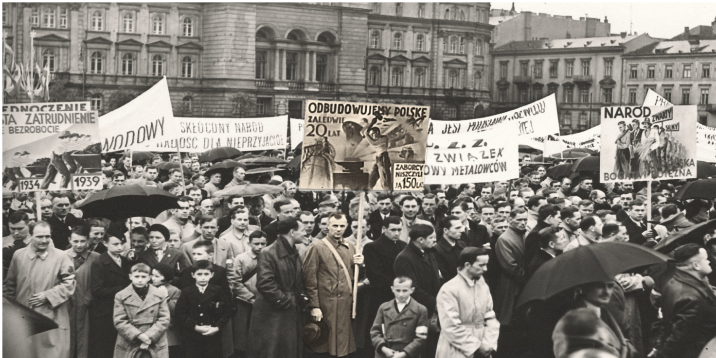
Manifestacja antywojenna w Warszawie, maj 1939 r.

https://przystanekhistoria.pl/pa2/tematy/nauka-i-technika/90736,Osiagniecia-i-niepowodzenia-II-Rzeczypospolitej.html