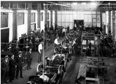
Fabryka samochodów General Motors w Warszawie - widok ogólny hali produkcyjnej, około 1930 r.