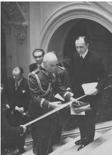
Generał Edward Rydz-Śmigły przecina wstęgę na otwarciu

W Rzeczypospolitej działał samorząd terytorialny, który zgodnie z ustawą sejmową z 1933 r. otrzymał dużą autonomię wobec władz centralnych, ruch spółdzielczy i zawodowy, liczne stowarzyszenia społeczne (m.in. młodzieżowe ze Związkiem Harcerstwa Polskiego na czele, kombatanckie, regionalne, katolickie oraz mniejszości narodowych i wyznaniowych). Powstała sieć bibliotek szkolnych i publicznych oraz Biblioteka Narodowa w Warszawie. Działały stowarzyszenia propagujące rozwój oświaty – Polska Macierz Szkolna, Towarzystwo Szkoły Ludowej, uniwersytety ludowe i robotnicze oraz liczne placówki kulturalne, m.in. towarzystwa przyjaciół sztuk pięknych i naukowe (Polska Akademia Umiejętności).