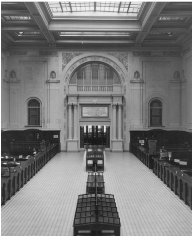
Sala główna Banku Polskiego przy ulicy Bielańskiej 10 w Warszawie, 1928 r.

Ziemię polską i życie społeczne wymagały ujednoczenia i likwidacji podziałów powstałych wskutek przynależności do trzech państw zaborczych, różniących się od siebie politycznie i gospodarczo. Proces ten dotyczył również sfery mentalnej – mieszkańcy Polski musieli nauczyć się traktować państwo i jego władze jak własne i uświadomić sobie obowiązki spoczywające na nich jako obywatelach Rzeczypospolitej. Nie było to łatwe, tym bardziej, że odzyskanie niepodległości odbyło się bez udziału większości spośród nich. W budowie państwa przydatne okazały się zdolności organizacyjne wyrobione w czasach niewoli, ukształtowane nurty polityczne oraz wielki entuzjazm elit społecznych dla idei pracy na rzecz niepodległej Polski.