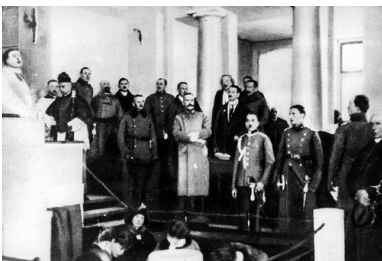
Otwarcie Sejmu Ustawodawczego w Warszawie. Widoczny m.in. naczelnik państwa Józef

Osiągnięcia kultury i gospodarki II Rzeczypospolitej zasługują na wysoką ocenę. W dziedzinie politycznej bilans wypada mniej pomyślnie. Niemożliwe okazało się nawiązanie dobrosąsiedzkich stosunków z większością sąsiadów. Niemcy i ZSRS kwestionowały niepodległość i integralność terytorialną Polski, a relacje z Czechosłowacją i Litwą paraliżowały konflikty terytorialne, przy czym żadna ze stron nie była skłonna do ustępstw. Nie udało się stworzyć rozsądnej i skutecznej polityki łagodzącej konflikty narodowościowe. Mniejszości narodowe korzystały z pełni praw konstytucyjnych, czego wyrazem była nieskrępowana – pod warunkiem że nie łamała prawa – działalność kulturalna i polityczna oraz swoboda wyznania. W życiu codziennym praw mniejszości nie zawsze przestrzegano, nie miały one również większego wpływu na kształtowanie polityki państwowej. Jednocześnie zdarzały się wypadki odrzucania i zwalczania państwowości polskiej przez obywateli Rzeczypospolitej narodowości niepolskiej.