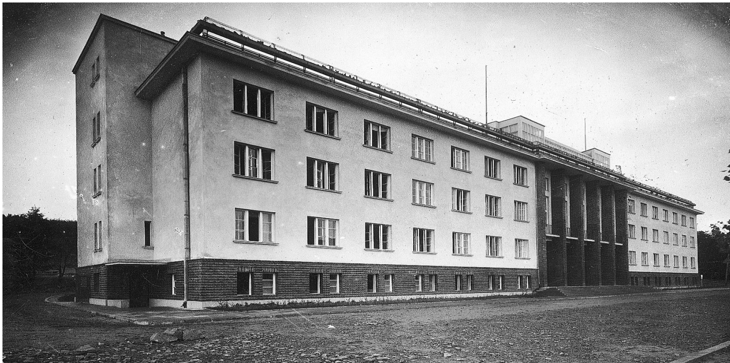
Zakład Leczniczo-Wychowawczy „Rodziny Kolejowej” im. Aleksandry Piłsudskiej w Rabce Zdroju

https://przystanekhistoria.pl/pa2/tematy/nauka-i-technika/99517,Wrazenia-z-podrozy-pozniej-Jan-Zienkiewicz-1897-1940.html