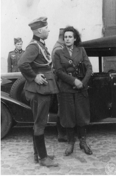
Reżyserka Leni Riefenstahl rozmawia z niemieckim oficerem, prawdopodobnie po przybyciu do miasta. Końskie, 12 IX 1939 r.

Innym ważnym filmem w twórczości Riefenstahl był reportaż, a w zasadzie kronika, z olimpiady w Berlinie w 1936 r., zatytułowany „Olympia”. W dokumencie tym reżyserka zastosowała wiele nowatorskich technik filmowych – wykorzystała różne rodzaje kamer, obiektywów i filtrów, by zarejestrować ruch człowieka. Kręciła także ujęcia w zwolnionym tempie. Pracowała w trudnych warunkach, co wymagało od niej jeszcze większej pomysłowości.