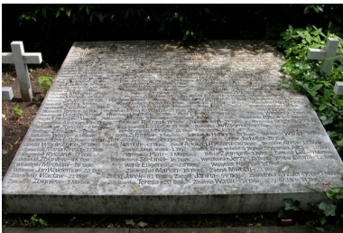
Nagrobek z nazwiskami zamordowanych polskich dzieci na cmentarzu Hochstraße

Kobiety przebywały w placówce przy Broitzemer Straße 200 osiem dni po rozwiązaniu. Następnie były odsyłane do pracy, niezależnie od stanu, w jakim się znajdowały.