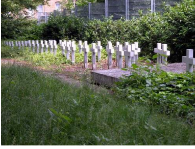
Cmentarz przy Hochstraße w Brunszwiku