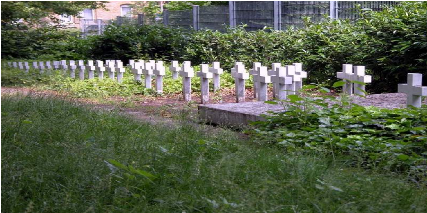
Cmentarz przy Hochstraße w Brunshwiku

https://przystanekhistoria.pl/pa2/tematy/niemcy/102063,Tragiczne-losy-polskich-robotnic-przymusowych-i-ich-dzieci-Dzialalnosc-zakladu-p.html