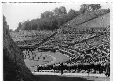
Uroczystość z udziałem Hitler-Jugend na Górze św. Anny, 22 maja 1938 r.

młodzieżowych oraz dzieci uczęszczające do niemieckich szkół mniejszościowych. W 1940 r. zdecydowano się na znaczne poszerzenie bazy rekrutacyjnej. Szybko jednak okazało się, że większość przyjętych wówczas dzieci nie znała języka niemieckiego.