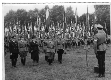
Uroczystość z udziałem Hitler-