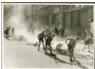
Członkowie Hitler-Jugend porządkujący ulice po alianckim nalocie na Głiwice, 1943 r.

Umundurowane formacje HJ często wykorzystywano do okraszania partyjnych wieców i innych tego typu wydarzeń. Członkowie tej organizacji byli też zobowiązani do udziału w licznych zbiórkach pieniędzy, materiałów wtórnych, prezentów dla żołnierzy itd. Wydarzeniom tym nadawano duży rozgłos propagandowy. Podobnie było z organizowanymi przez HJ zawodami sportowymi. W okresie Bożego Narodzenia członkowie HJ wykonywali zabawki, które następnie sprzedawane były na jarmarkach bożonarodzeniowych organizowanych we wszystkich większych miejscowościach. Zgromadzone środki przekazywano na cele opieki społecznej.