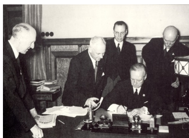
Podpisanie przez ministra spraw zagranicznych III Rzeszy Joachima von Ribbentropa niemiecko-sowieckiego paktu o nieagresji (tzw. Paktu Ribbentrop-Mołotow) w Moskwie, 23/24 sierpnia 1939 r.

Pakt między Hitlerem a Stalinem oznaczał czwarty rozbiór Polski oraz podział reszty obszarów wschodnioeuropejskich na strefy wpływów. Wiadomość o jego zawarciu wywołała na świecie szok, rozwiązała zarazem brytyjskie oraz francuskie nadzieje na układ bezpieczeństwa ze Związkiem Sowieckim. Dla wszystkich stało się jasne, że wojna jest o krok. Nic jeszcze nie wiadomo o tajnym załączniku, czyli planie rozbioru Polski i podziału Europy Wschodniej.