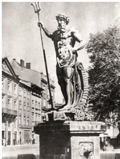
Studnia Neptuna na rynku we Lwowie. Zdjęcie niemieckie z lat czterdziestych.

Okres staropolski w dziejach miasta został całkowicie pominięty. Między średniowiecznym osadnictwem a rokiem 1772 zdarzyły się, według przewodnika, tylko bliżej niesprecyzowane „wojny i pożary”, a „Niemcy z uwagi na odkrycie nowej drogi do Indii zmieniają kierunki ekspansji”. Miasto znowu miało rozkwitnąć razem z kolejnym zastrzykiem żywołu niemieckiego, a wszystko dzięki dalekowzroczej polityce austriackiej, czyli dzięki wznowieniu akcji osadniczej, przybyciu urzędników i specjalistów oraz założeniu uniwersytetu w 1784 r. z językiem niemieckim funkcjonującym jako wykładowy do 1871 r. Lwów zyskał miano Małego Wiednia Wschodu – Klein Wien des Ostens . Po roku 1871 w mieście jednak znowu miało się nic nie dziać. Wzmiankowane są hasłowo walki rosyjsko-austriackie i polsko-ukraińskie w czasie I wojny światowej. O latach 1918-1939 znów ani słowa. Rys historyczny kończą suche informacje o zdobyciu przez Niemców zachodnich dzielnic miasta do 19 września 1939 r. i przejęciu go przez Rosjan na 21 miesięcy.