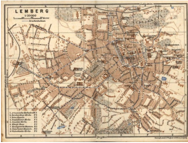
Plan Lwowa z niemieckiego przewodnika po GG, 1943 r.

wzgórzu zamkowym (Schlossberg) jest mowa o punkcie widokowym i rozciągającej się stamtąd „wspaniałej panoramie”. Ale i w tym miejscu znowu pada znamienne: „1942 – zamknięte”.