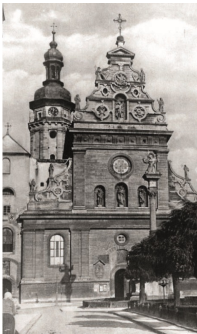
Kościół bernardyński. Zdjęcie niemieckie z lat czterdziestych.