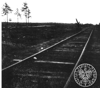
Widok na bocznice kolejowa obozu zagłady w Treblince, 7 listopada 1945 r.