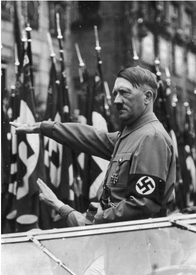
Kanclerz Rzeszy Adolf Hitler odbierający defiladę. Maj 1937.

W skład Trybunału Norymberskiego wchodził przedstawiciel czterech zwycięskich mocarstw - USA, Wielkiej Brytanii, Francji i ZSRS. Każde z państw delegowało po dwóch reprezentantów swojego kraju do składu sędziowskiego oraz po jednym do Komitetu Oskarżycielskiego, do którego należeli prokuratorzy.