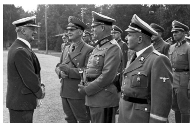
Od lewej: admirała Miklos Horthe, minister spraw zagranicznych Rzeszy Joachim von Ribbentrop, marszałek Wilhelm Keitel, Reichsleiter Martin Bormann.

Wartym odnotowania jest, że pozostali uwięzieni naziści wyrazili ulgę z powodu śmierci byłego współpracownika. Twierdzili bowiem, że Ley mógłby w trakcie procesu skompromitować nie tylko siebie, ale i całą strukturę niemieckiego reżimu.