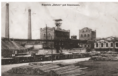
Kopalnia „Saturn” w Czeladzi, 1912 r.

Kolejne miesiące przyniosły unormowanie sytuacji, chociaż daleko było do jej zupełnego wyjaśnienia. W lipcu 1919 r. rozwiązano ostatecznie rady delegatów robotniczych. W sierpniu w Mysłowicach doszło do masakry górników przez oddział Grenzschutzu, co doprowadziło do wybuchu I Powstania Śląskiego. Powoli konflikt graniczny odsuwał się od Zagłębia na zachód.