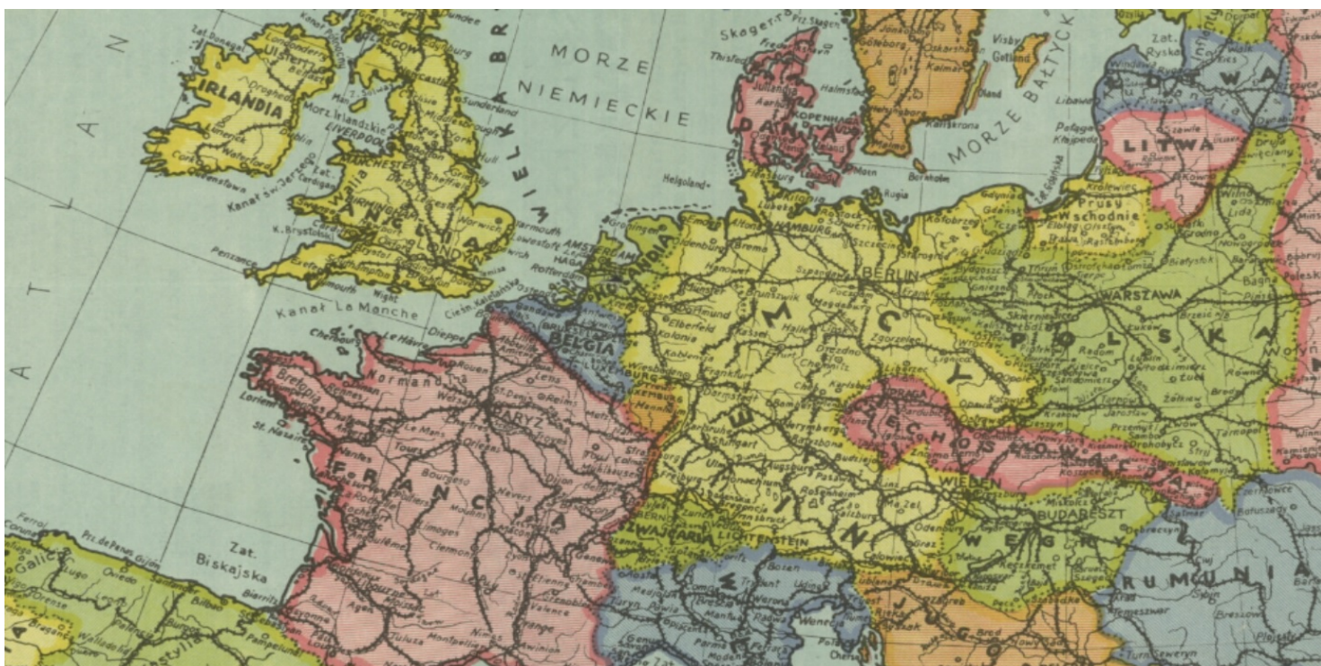
Europa w 1938 r.

https://przystanekhistoria.pl/pa2/tematy/niemcy/78223,Polski-przeklad-Mein-Kampf-Moja-Walka.html