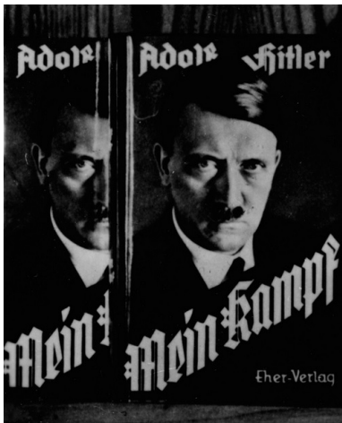
Okładka książki Mein Kampf z podobizną Adolfa Hitlera.