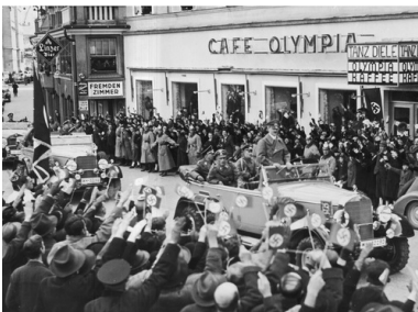
Wizyta Adolfa Hitlera w Linzu po