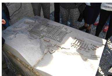
Makieta Gusen I i Gusen II ustawiona przed Memorial Gusen.

KL Gusen I i jego filia Gusen II zostały podobnie jak KL Mauthausen wyzwolone najpóźniej ze wszystkich obozów. Głównym powodem tego był fakt, że rejon ten znalazł się na styku dwóch wielkich ofensyw, radzieckiej napierającej ze wschodu i alianckiej z zachodu. Mimo zbliżających się frontów, życie obozowe w Gusen biegło swoim zbrodniczym rytmem, a tysiące więźniów pracowało nadal w halach produkcyjnych takich firm jak austriacki koncern Steyr-Daimler-Puch AG oraz niemiecki Messerschmitt AG. W 1945 r. średnia życia przeciętnego więźnia w Gusen wynosiła zaledwie trzy miesiące! To tyle, ile założyli sobie, tworząc ten obóz, nazistowscy zbrodniarze. Głównym powodem tak wysokiej śmiertelności w tym okresie, były drastyczne braki w zaopatrzeniu w żywność, co wywołało w obozie ogromny głód i to na kilkanaście dni przed wyzwoleniem. Była to sytuacja, która zagroziła egzystencji trzymających się resztek nadziei tysięcy więźniów, a wkrótce okazało się, że nie byli oni jedynymi, których należało wówczas nakarmić.