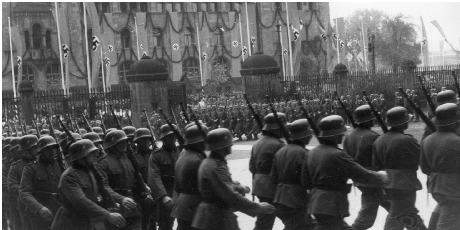
Objęcie przez Arthura Greiser'a urzędu namiestnika w Kraju Warty, 2 listopada 1939 r.

https://przystanekhistoria.pl/pa2/tematy/niemcy/94352,Winni-nieosadzeni-rozwazania-o-niemieckich-sprawcach-h-w-rocznice-procesow-Greiser.html