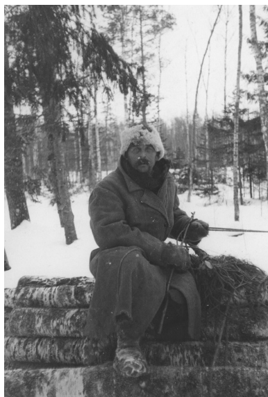
Mężczyzna na wozie z drzewem w lesie w okolicach Lipowej koło Sokółki (okres międzywojenny).

Wolność odzyskała więc właściwie bez walk. Ofiarę krwi za niepodległość Sokólszczyzny oddali jednak jej synowie kilka miesięcy wcześniej.