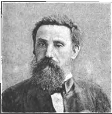
Portret Bolesława Limanowskiego z książki „Upominek. Książka zbiorowa na cześć Elizy Orzeszkowej (1866-1891)”

Oznaczało to wysunięcie na plan pierwszy postulatu walki o niepodległość.