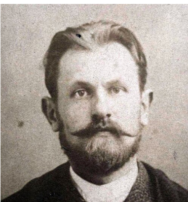
Stanisław Wojciechowski po zatrzymaniu przez policję