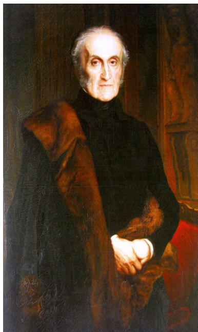
Książę Adam Jerzy Czartoryski

Emigranci – a byli pośród nich nie tylko wybitni politycy, wysokiej rangi wojskowi, wielcy poeci, ale i zawodowi oficerowie różnych rang, drobna szlachta, studenci czy żołnierze wywodzący się ze sfer rzemieślniczych i chłopskich – których liczba przekraczała nieco 10 tysięcy, nie rezygnowali z planów wywołania nowego ogólnonarodowego powstania skierowanego przeciwko zaborcom. Zamierzali też uzyskać dla swej walki poparcie zachodniej Europy. Poparcie co najmniej dyplomatyczne i materialne, a jeśli okazałoby się to możliwe, i militarne.