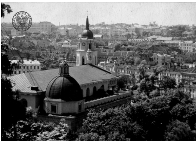
Panorama Wilna w okresie 1918-1939 widziana z podnóża Góry Zamkowej. Na pierwszym planie Katedra Wileńska pw. Św. Stanisława

19 kwietnia ok. 2.45 polska kawaleria dotarła pod Wilno i ok. 3.30 rozpoczęła atak na miasto. W zaciętych walkach opanowano dworzec kolejowy. Wileńscy kolejarze wsparli polskie wojsko, unieruchamiając pociągi. Ochotnicy-kolejarze zostali uzbrojeni w zdobyczną broń. Polska ludność cywilna, częściowo z bronią w ręku, wspierała polskie siły. Zdobyto kluczowe punkty miasta, jak Górę Zamkową, czy plac Katedralny, i wzięto od 1000 do 1200 jeńców, jednak po południu nieprzyjaciel zaczął stawiać twardszy opór, a następnie nawet przechodzić do kontrataku, korzystając z tego, że polskim ułanom kończyła się amunicja. Na szczęście ok. 20.00 dotarł do Wilna batalion piechoty ze zgrupowania Rydza Śmigłego (837 ludzi, 8 ckm-ów), który udało się przerzucić zdobytym w Wilnie pociągiem.