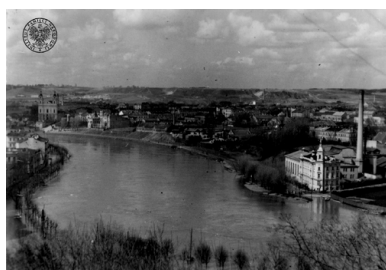
Panorama Wilna w okresie 1918-1939 widziana z podnóża Góry Zamkowej. Na pierwszym planie Katedra Wileńska pw. Św. Stanisława

Pod koniec 1918 r. odrodzone Państwo Polskie kontrolowało tereny byłego Królestwa Kongresowego i Galicji Zachodniej. 27 grudnia 1918 r. wybuchło powstanie wielkopolskie. Toczyły się walki z Ukraińcami o Lwów i zaostrzał się konflikt z Czechosłowacją o Śląsk Cieszyński.