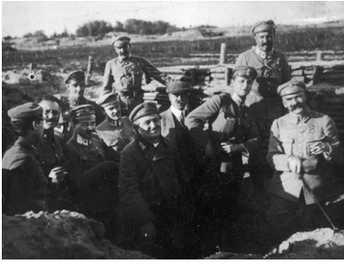
Wizyta bp. Władysława Bandurskiego (na pierwszym planie, w koloratce) na froncie wschodnim nad Styrem, maj 1916 r.

Również pozostałe polskie formacje wojskowe okresu I wojny światowej, powstałe przy armiach dotychczasowych zaborców, miały swoich kapelanów. Tak było w Legionie Puławskim, Dywizji Strzelców Polskich, I Korpusie Polskim oraz Legionie Polskim w Finlandii. Także w utworzonej we Francji Armii Polskiej, dowodzona przez gen. Józefa Hallera, której znaczną część stanowili polscy ochotnicy ze Stanów Zjednoczonych. W armii tej działało rozbudowane duszpasterstwo z 22 kapelanami, z których aż 19 pochodziło z USA.