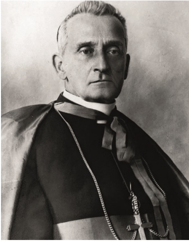
Abp Adam Stefan Sapieha.