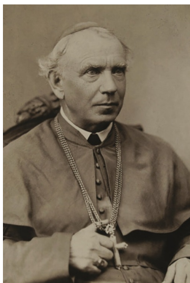
Abp Zygmunt Szczęsny Feliński.

Inną wybitną postacią tego okresu był ks. Piotr Wawrzyniak (1849–1910), działacz społeczny, gospodarczy i oświatowy nazwany przez dziennik „Berliner Tageblatt” – „niekoronowanym królem polskim”. Wprawdzie w sejmie pruskim sprawował mandat posła tylko przez jedną kadencję (1893-1898), jednak był faktycznym przywódcą politycznym Polaków w całym zaborze. W trakcie jego działalności patronackiej nad spółdzielniami kredytowymi ich liczba wzrosła z 79 do 265, liczba zaś członków – z 28 tys. do 125 tys. W 1910 r., na krótko przed śmiercią, stanął na czele Centralnego Komitetu Wyborczego, obejmującego nie tylko ziemie pruskie, lecz także emigrację polską w Niemczech.