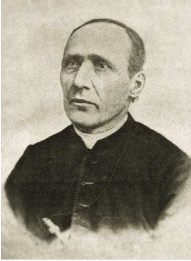
Ks. Stanisław Stojałowski.