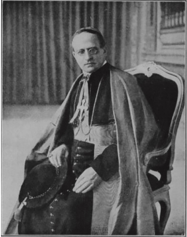
Photograph taken shortly after his Consecration

Ks. prałat Achille Ratti, późniejszy papież Pius XI.