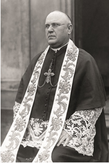
Abp Aleksander Kakowski.

Kolejnym krokiem abpa Kakowskiego było dążenie do zapewnienia ziemiom polskim przedstawiciela Stolicy Apostolskiej niezależnego od dotychczasowych zaborców. Te zabiegi przyniosły efekt wiosną 1918 r., kiedy do Warszawy przybył jako delegat Watykanu ks. Achille Ratti, późniejszy papież Pius XI. Jak się okazało, Polska zyskała nie tylko oficjalną sankcję w świecie dyplomacji międzynarodowej, lecz także oddanego przyjaciela, który odegrał ważną rolę w czasie wojny polsko-bolszewickiej.