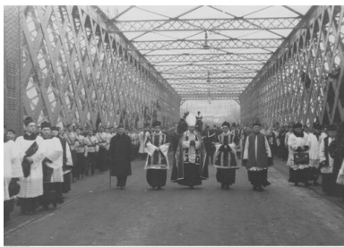
Pogrzeb Romana Dmowskiego w Warszawie w 1939 r.