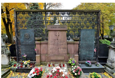
Grób Romana Dmowskiego, cmentarz Bródnowski w Warszawie.