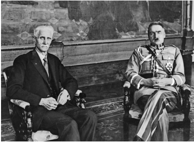
Marszałek sejmu Ignacy Daszyński i marszałek Józef Piłsudski, 1928 r.