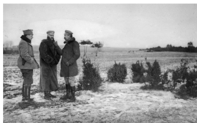
Od prawej: Józef Piłsudski, Ignacy