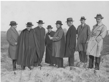
Członkowie Komitetu Budowy Kościoła Opatrzności Bożej w Warszawie. Abp Adam Sapieha (drugi z lewej), kard. August Hlond (trzeci z lewej), Ignacy Daszyński (trzeci z prawej), 1928 r.