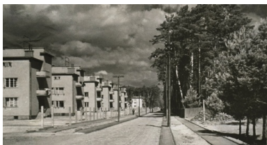
Kolonia robotnicza w Stalowej