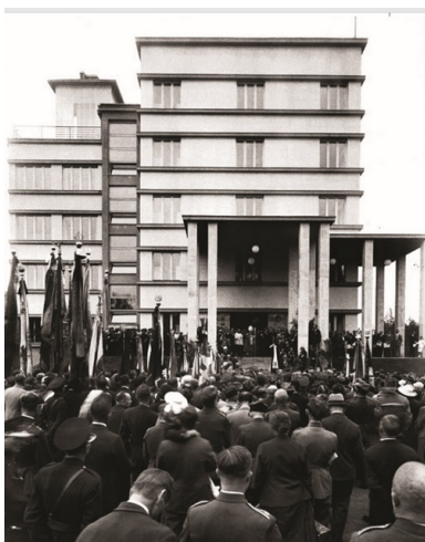
Poświęcenie Domu Legionisty w