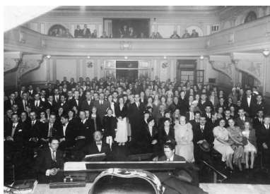
Koło teatralne "Wierni Hasłom Marszałka Józefa Piłsudskiego" w Buenos Aires. Widok na salę podczas spektaklu "Śmierć Okrzei", maj 1934 r.