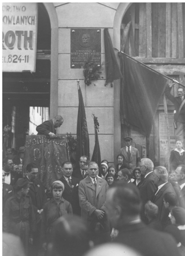
Odsłonięcie tablicy pamiątkowej ku czci działacza niepodległościowego i socjalistycznego Stefana Okrzei na budynku Robotniczego Domu Ludowego w Warszawie, maj 1933 r.