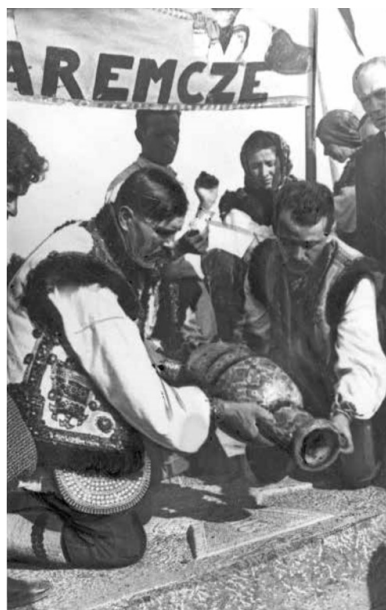
Delegacja Huculów sypie przywiezioną ziemię.