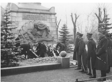
Składanie rocznicowych wieńców u stóp pomnika Powstańców Wielkopolskich na poznańskim Górczynie, XII 1932 r. Na grobowcu z 1924 r. nad przestawieniem Matki Bożej pochylającej się nad ciałem