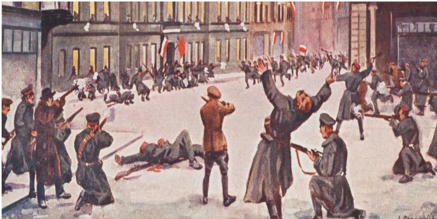
L. Prauziński, Szturm powstańców na budynek Prezydium Policji 27 XII 1918 r. Pocztówka ze zb. Biblioteki Narodowej

https://przystanekhistoria.pl/pa2/tematy/niepodleglosc/61083,Grudniowa-wiktoria.html