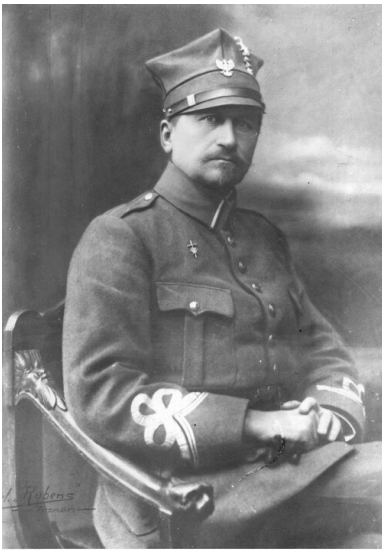
Gen. Józef Dowbor-Muśnicki (1867-1937)

Frontowej walce o utrzymanie zdobytych pozycji, towarzyszyła zakulisowa rozgrywka dyplomatyczna, której centrum znajdowało się w Trewirze. To właśnie tam (bez polskiego udziału) odbyło się kolejne posiedzenie Komisji Rozejmowej. W jego trakcie niemieccy dyplomaci ulegli pod presją ultimatum postawionego przez