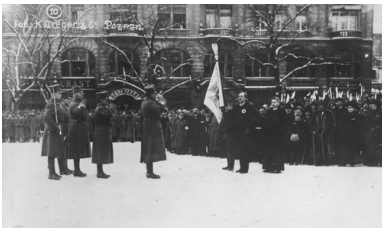
Poznań (obecny plac Wolności), 26 stycznia 1919 r. przysięga Wojsk Wielkopolskich. Gen. Józef Dowbor-Muśnicki przy sztandarze przedstawiciele Naczelnej Rady Ludowej Wojciech Korfanty i ks. Stanisław Adamski.

marszałka Ferdynanda Focha. Strona niemiecka, zagrożona wznowieniem działań wojennych na zachodzie, oddała wówczas pole i 16 lutego 1919 r. i zgodziła się na podpisanie dokumentu przedłużającego rozejm z Compiègne na czas nieokreślony oraz uzupełnienie jego treści o kluczowy dla walczącej Wielkopolski akapit, w myśl którego Niemcy miały „zaniechać niezwłocznie wszelkich kroków przeciwko Polakom w Poznańskim”. Niemieckie siły otrzymały zakaz przekraczania linii demarkacyjnej wytyczonej wzdłuż frontu niemiecko-wielkopolskiego. Oznaczało to w istocie formalne uznanie przez mocarstwa zachodnie wyniku powstania wielkopolskiego, wyłączenie Poznańskiego spod niemieckiego zwierzchnictwa, a także otwierało drogę do tak wyczekiwanej przez wszystkich Poznańczyków wolnej Polski.