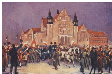
L. Prauziński, Wjazd I.J. Paderewskiego do Poznania 26 XII 1918 r. Pocztówka ze zb.